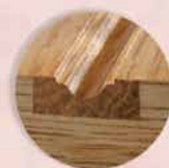
Detalle canal de madera.

Serie lisa con acabados fresado pico de gorrión e incrustaciones de madera o aluminio.