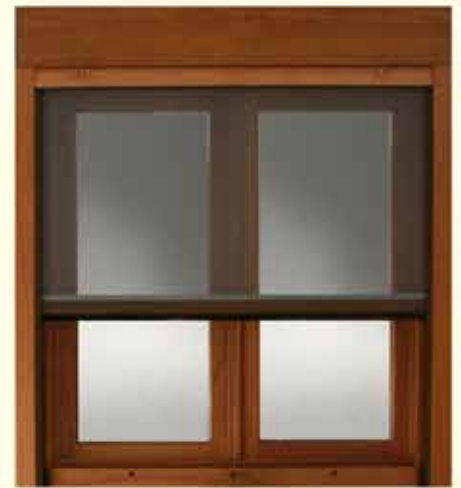
Md. Con persiana y/o mosquitera