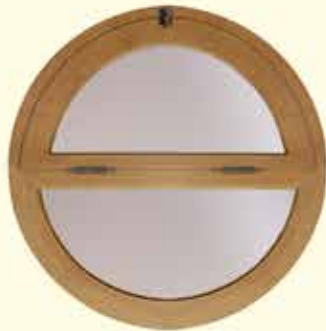
Md. Ojo de buey