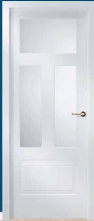
Md. LC-6000 V/3