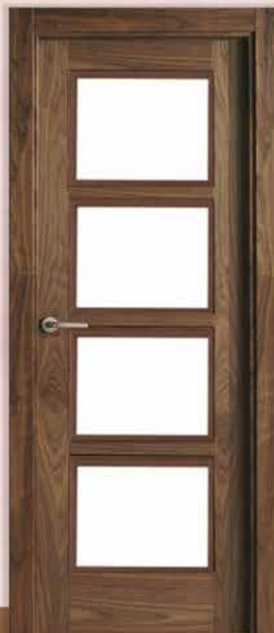
Md. L-1006 V/4

Serie lisa con acabados fresado pico de gorrión e incrustaciones de madera o aluminio.