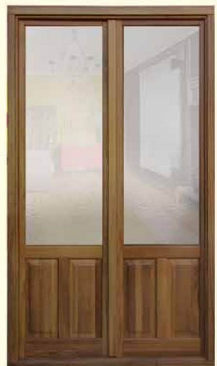
Md. Balcón europeo clásico

Amplia variedad de vidrieras pintadas a mano.