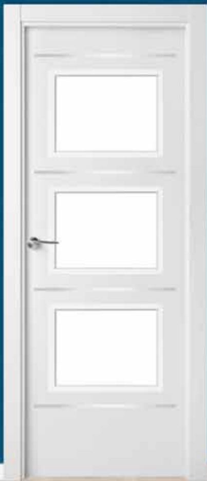
Md. LA-4000 V/3