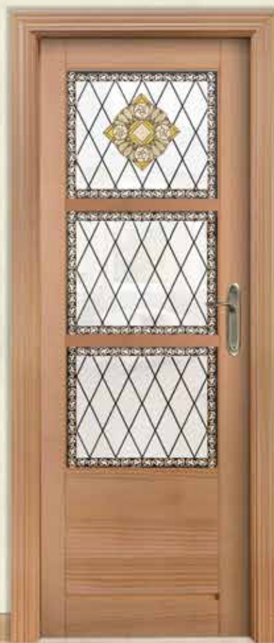
Md. 505 3V