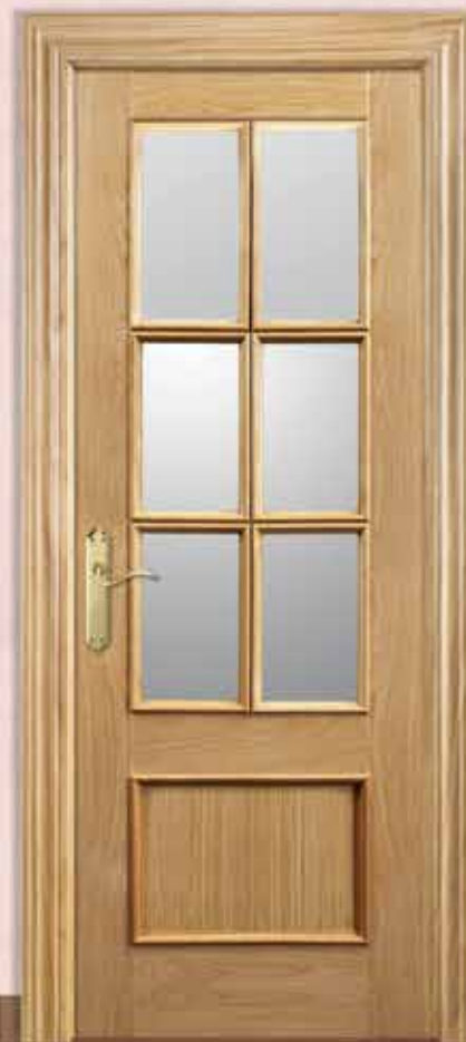
Md. S/RLV-1 V6