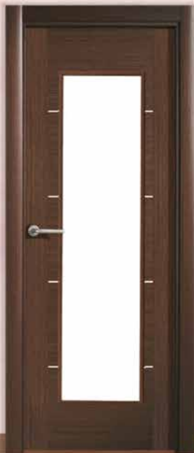
Md. L-1005 V/1