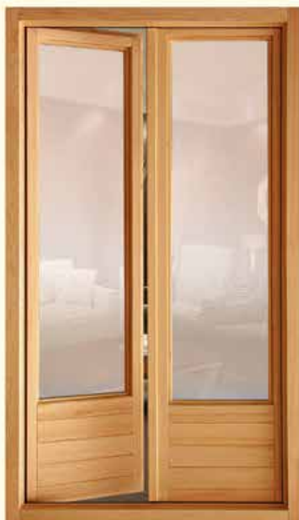
Md. Balcón europeo moderno

Amplia variedad de vidrieras pintadas a mano.