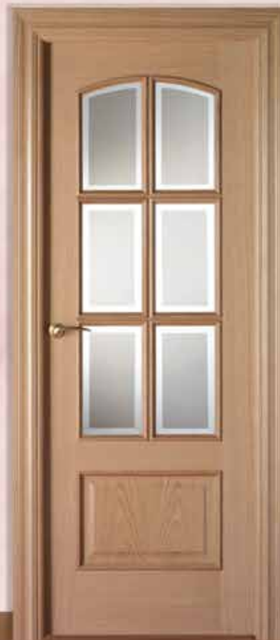
Md. RLV-3 V6