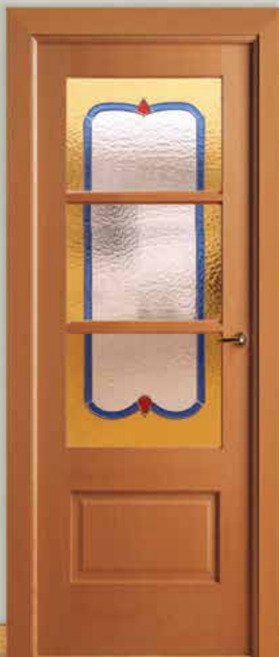
Md. MX-5000 V/3