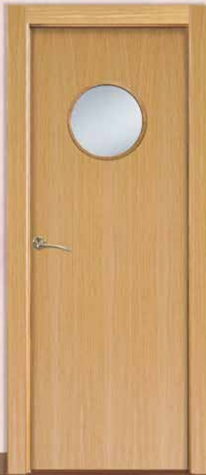
Md. L-1000 ojo de buey