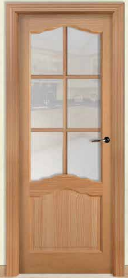
Md. 506 6V