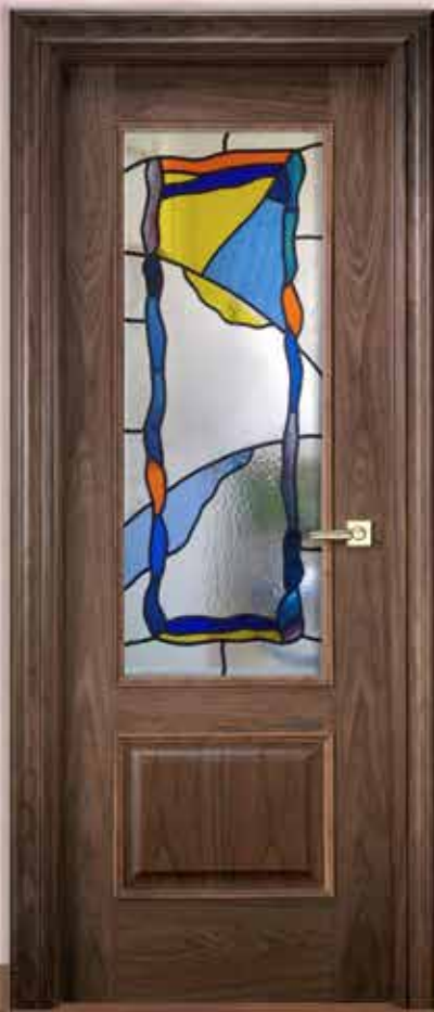
Md. RLV-1 V1