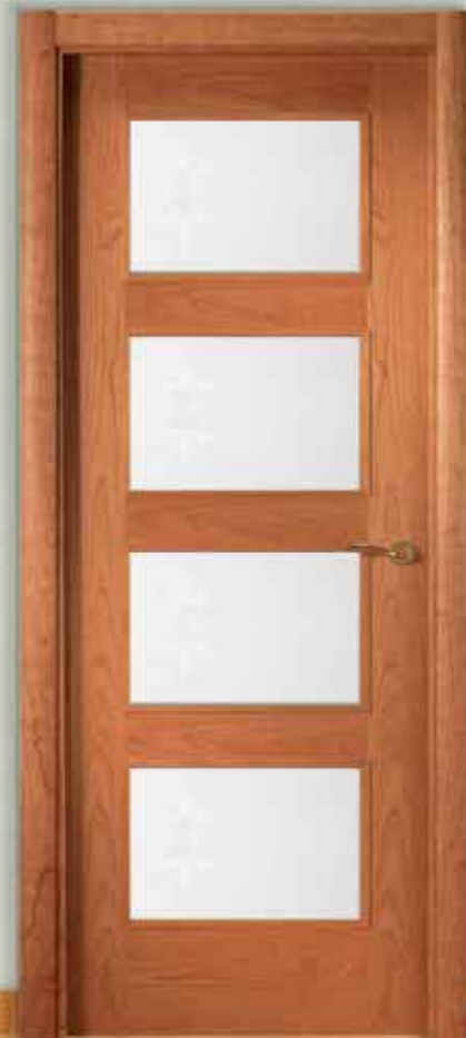
Md. MP-3000 V/4