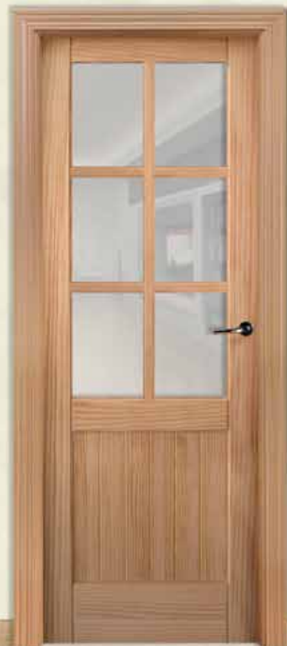
Md. 504 6V