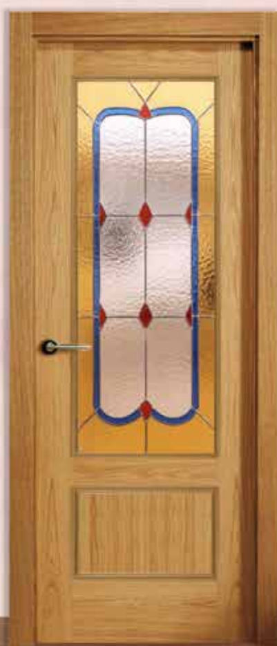
Md. S/RLV-1 V1