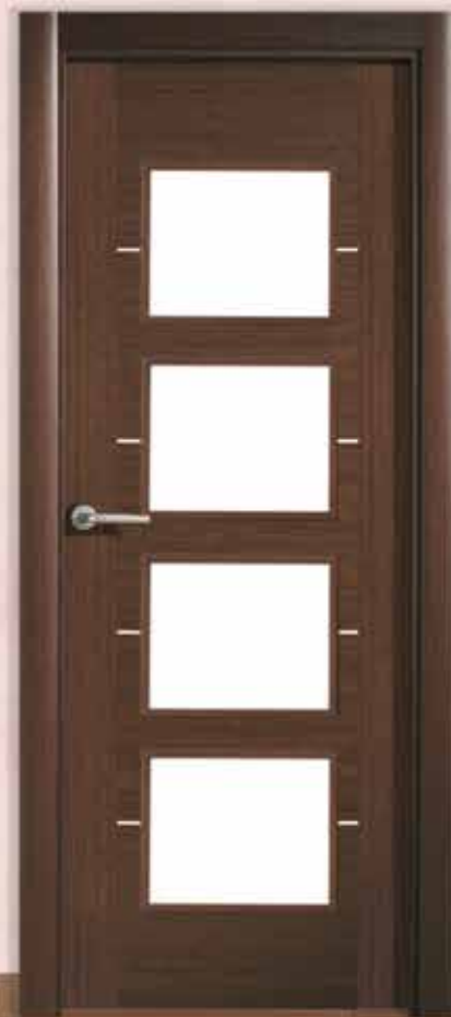
Md. L-1005 V/4