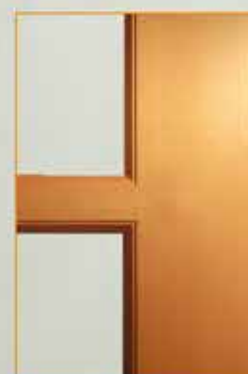
Detalle moldura MX