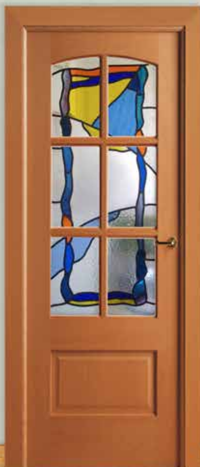
Md. MX-5001 V/6