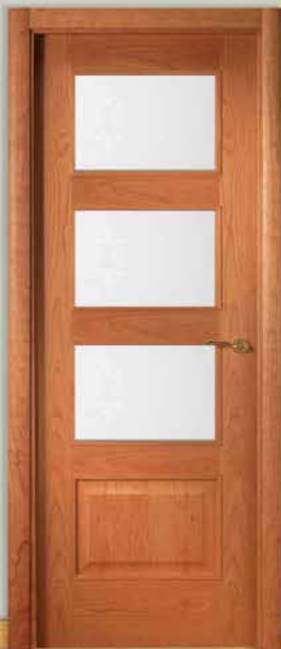
Md. MP-3000 V/3