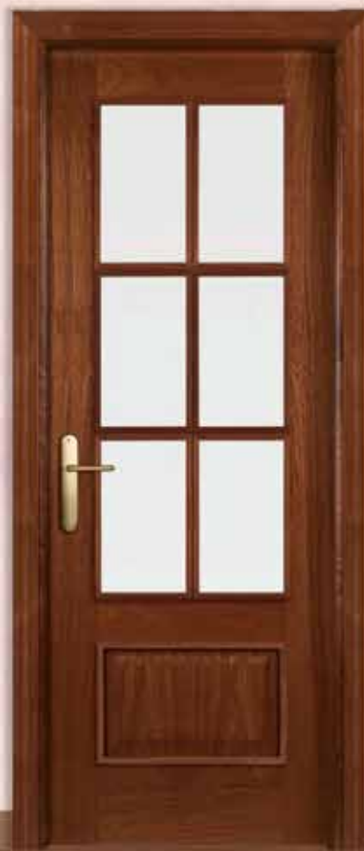
Md. RLV-1 V6