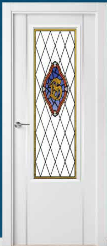
Md. LA-4001 V/1