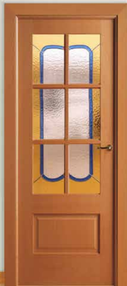
Md. MX-5000 V/6