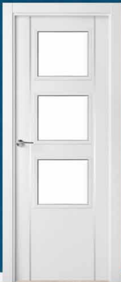
Md. LA-4001 V/3