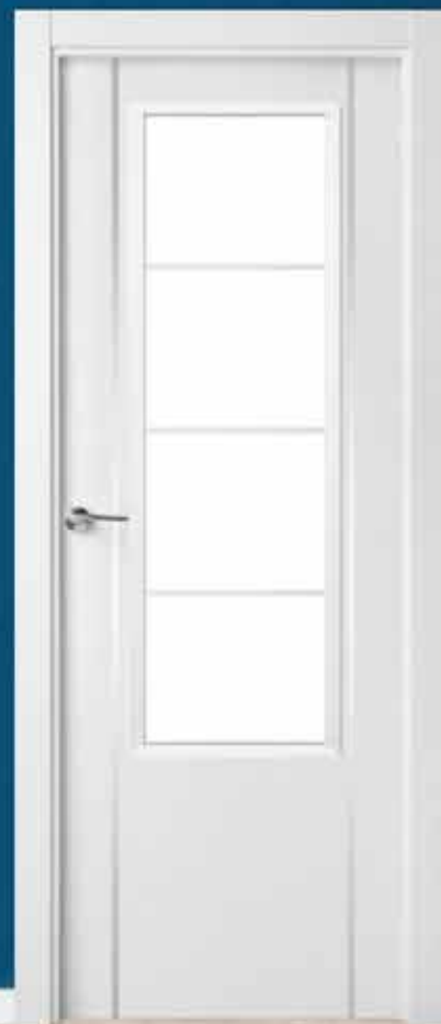
Md. LA-4001 V/4