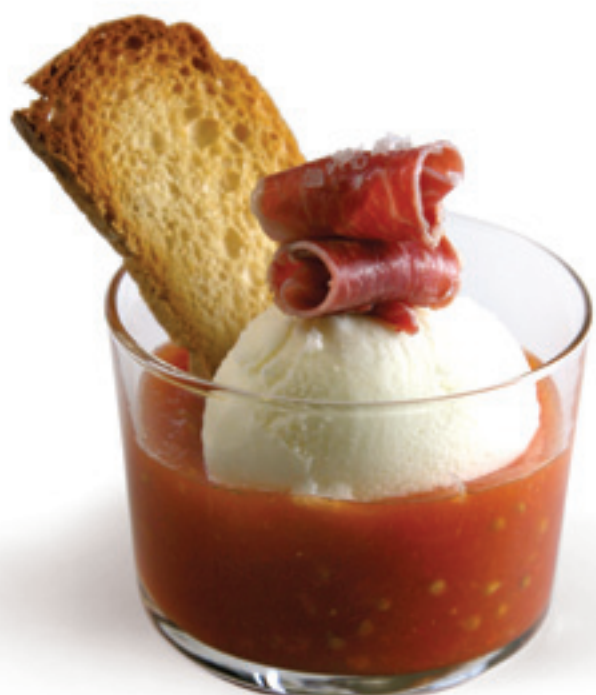
Pan con tomate, jamón y helado de aceite de oliva virgen extra