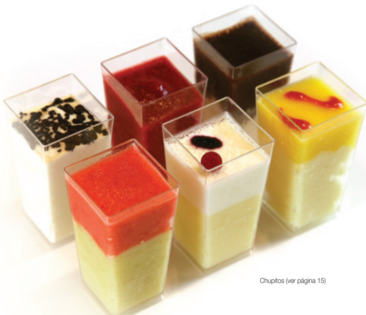
Chupitos (ver página 15)