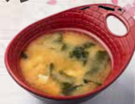
A2 Sopa Miso Miso Soup