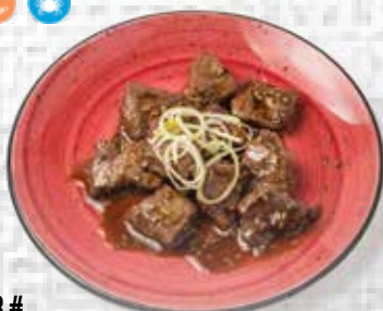
88# Entrecot en salsa Yakiniku Steak Yakiniku