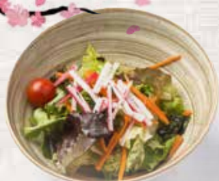
1 Ensalada de la casa House salad