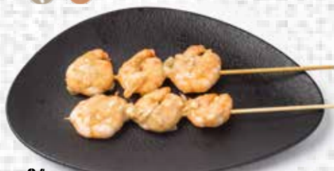
84 Brocheta de langostino Shrimp stay