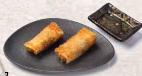
7 Rollito de la casa Spring rolls