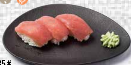
35# Nigiri de atún Tuna nigiri