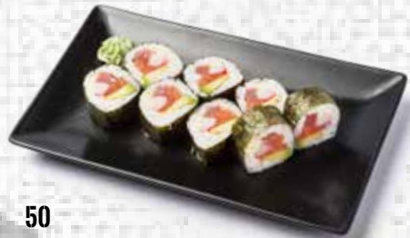
50 Fotomaki (Menú 4 ud.) Fotomaki (Menu 4 u.) 7.50€