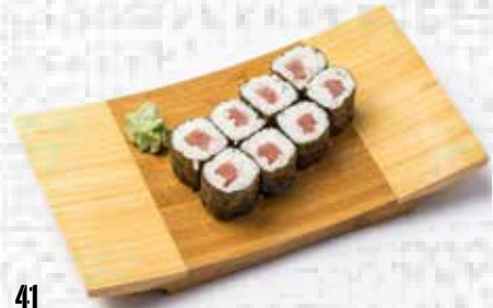
41 Maki de atún Tuna maki 4.50€