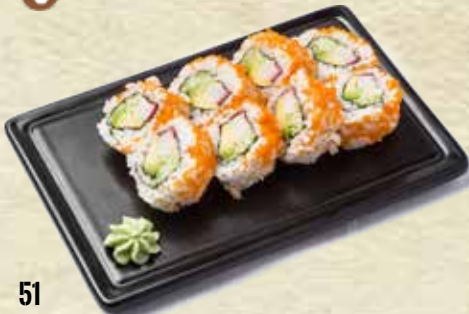
51 California Masago (Menú 4 ud.) Masago California (Menu 4 u.)