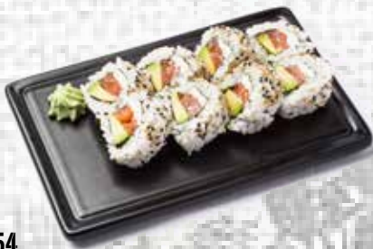
54 California salmón con queso (Menú 4 ud.) Salmon cheese California roll (Menu 4 u.) 6.95€