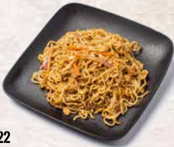
22 Fideos Yakisoba Yakisoba noodles