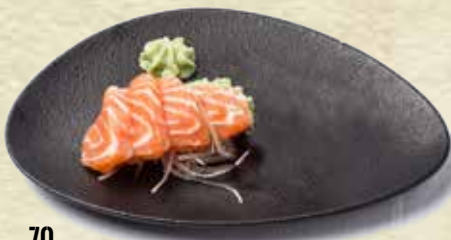
70 Sashimi de salmón