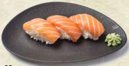
32 Nigiri de salmón Salmon Nigiri