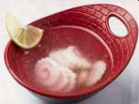
A1 Sopa Marisco Seafood Soup