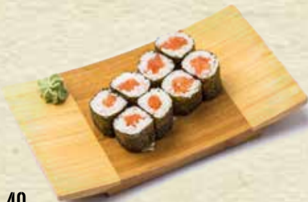
40 Maki de salmón Salmon maki