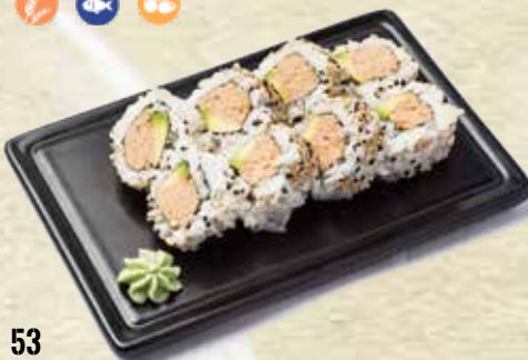
53 California atún cocido (Menú 4 ud.) Tuna cooked California roll (Menu 4 u.)