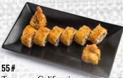
55 # Tempura California (Menú 4 ud.) California tempura (Menu 4 u.) 8.25€