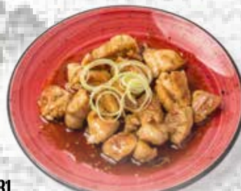
81 Muslo de pollo con salsa Yakiniku Chicken with Yakiniku