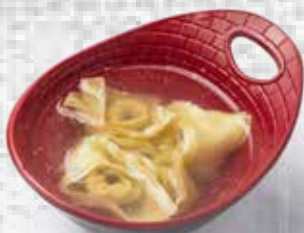
A3 Sopa Wonton Dumpling soup