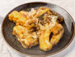
16 Berenjenas agripcantes Sweet and sour eggplant