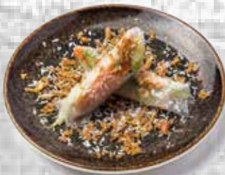
65 # Roll de langostino y coco Shrimp rolls with coconut 1.95€