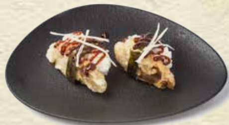
63 Nigiri pato Duck nigiri