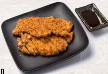
10 Panko lomo de cerdo Tonkatsu pork