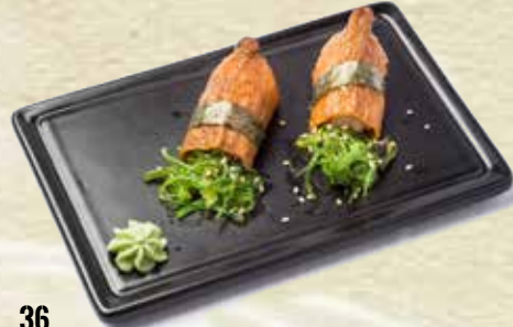
36 Nigiri Inari Tofu Inari nigiri Tofu