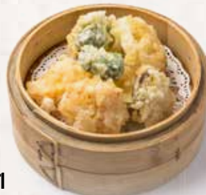
11 Tempura de verduras Vegetables tempura