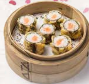
9 Tempura maki salmón Salmon maki tempura