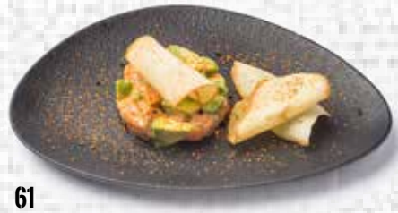
61 Tarta de salmón Salmon cake 4.10€