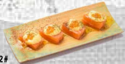
62 # Salmón con salsa blanca White sauce salmon 3.85€