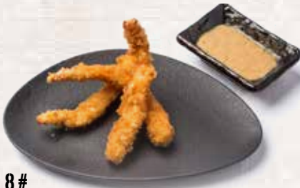
8# Langostino Panko Shrimp panko