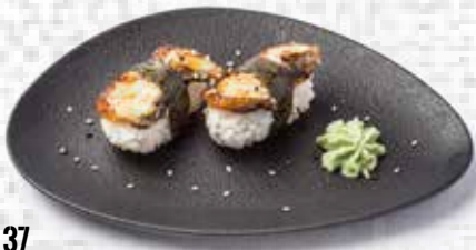
37 Nigiri de anguila Eel nigiri 2.95€