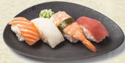
31 Nigiri mixto Mixed nigiri