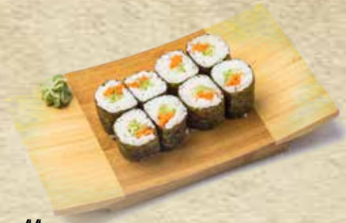
44 Maki de verdura Vegetables maki