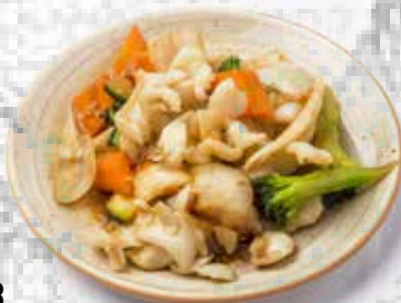
93 Sepia con verduras Cuttlefish with vegetables