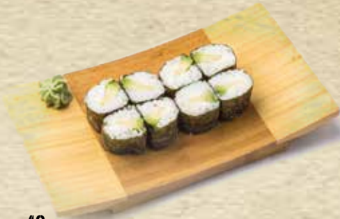
43 Maki de aguacate con queso Avocado cheese maki