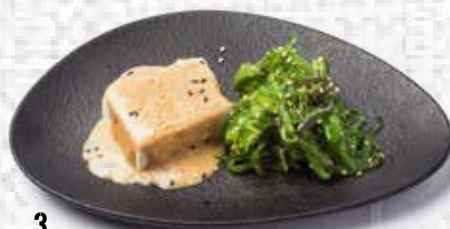
3 Tofu, Wakamen y sésamo Seaweed and tofu with sesame