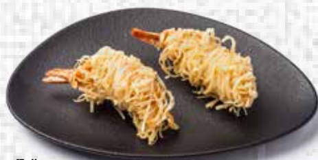
5# Langostino frito Fried shrimp rolls