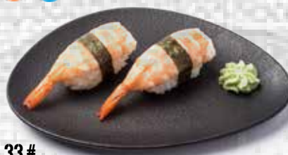
33# Nigiri de langostino Shrimp nigiri