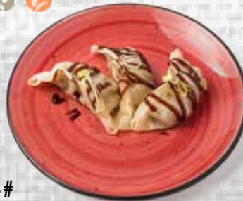
14# Gyoza de pato (Menú 2 ud.) Duck dumpling (Menu 2 u.)