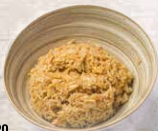
20 Arroz frito con salsa de soja Soy sauce fried rice