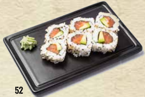
52 California salmón (Menú 4 ud.) Salmon California (Menu 4 u.)