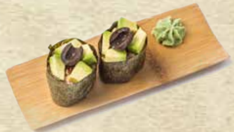
60 Gunkan atún cocido Cooked tuna Gunkan