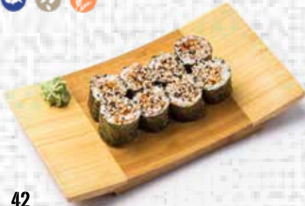
42 Maki de pollo yakitori Yakitori chicken maki 4.20€