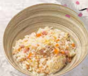
21 Arroz frito con mantequilla Butter fried rice