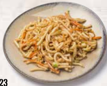
23 Udon frito con salsa de soja Fried udon with soy sauce