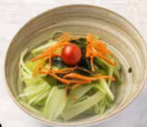
2 Ensalada de pepino Cucumber salad