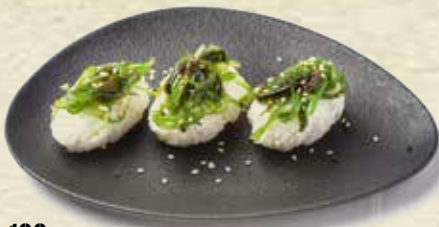
100 Nigiri Wakamen Goma Wakame nigiri