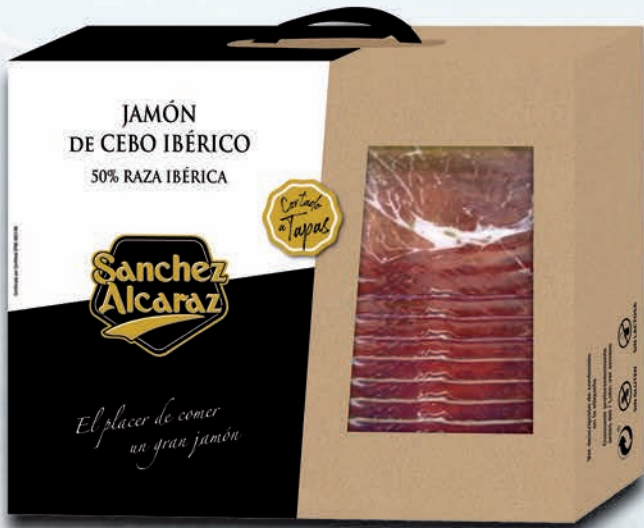
ESPECIALIDAD N°1 60,00€+IVA

1 Estuche de Lujo 14 Platos Tapas 80 Grs. Jamón Ibérico Cebo 1,12 Kgs. Sánchez Alcaraz