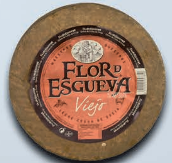
ESPECIALIDAD N°7 42,00€+IVA

1 Estuche de Madera Queso de Oveja GRAN RESERVA 3,300 ALBÉNIZ