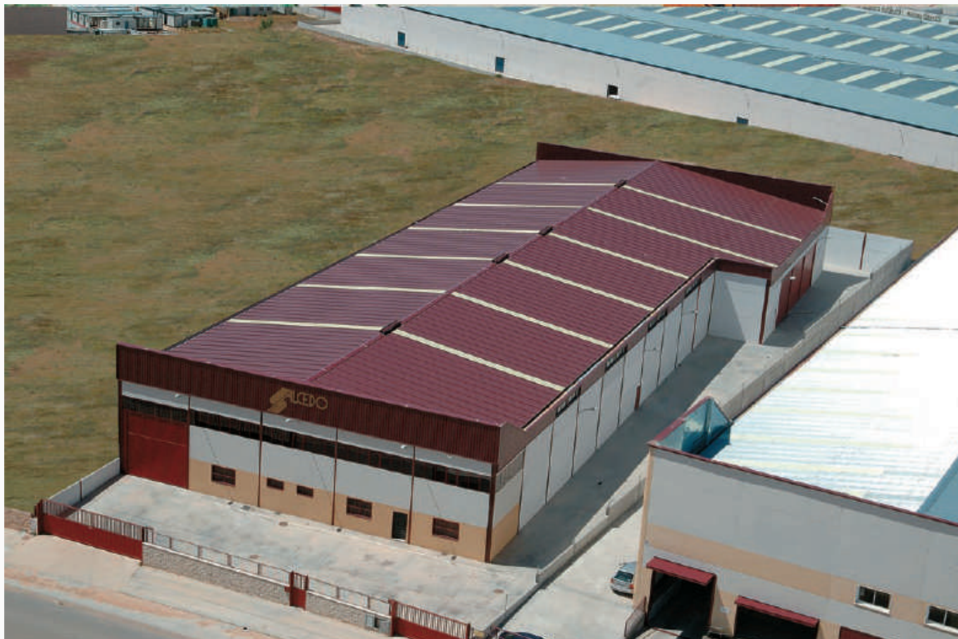
Vista Fábrica de Lotes y Cestas de Navidad Avda. Monte Boyal Nº173 Pol. Ind. Casarrubios del Monte TOLEDO