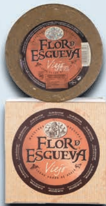
ESPECIALIDAD N°5 15,00€+IVA

1 Estuche Queso Puro de Oveja "Leche Cruda" 1 Kg. Aprox. HACIENDA ZORITA