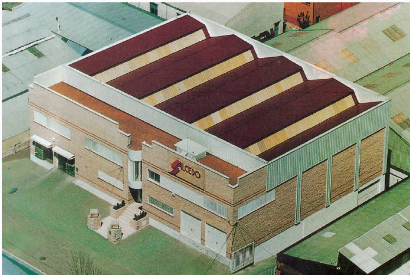
Vista Naves Centrales C/Mercurio Nº 12 Pol. Ind. San José de Valderas MADRID