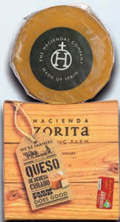
ESPECIALIDAD N°4 14,00€+IVA

1 Canister Lomo Ibérico de Bellota 1 Kg. Aprox. 5 Jotas Sánchez Romero Carvajal