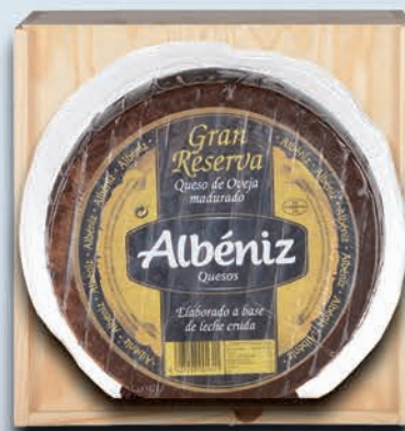
ESPECIALIDAD N°6 35,00€+IVA

1 Pieza Queso Puro de Oveja 1,100 Kgs. Aprox. FLOR DE ESGUEYA