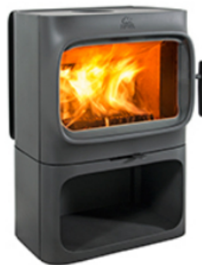
Jotul F 305 B BP (1.800 € IVA incl)