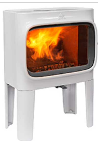
Jotul F 305 LL WHE (2.100 € IVA incl)