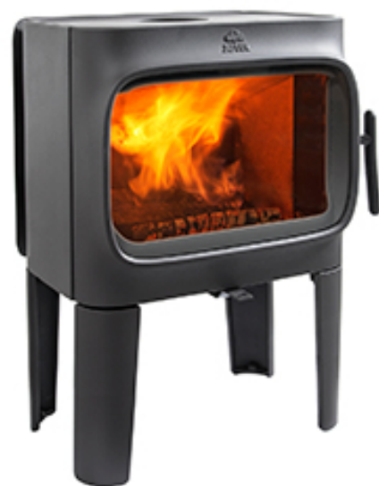
Jotul F 305 LL BP (1.600 € IVA incl)

Como oferta de lanzamiento, 10% de descuento adicional para modelos en exposición.