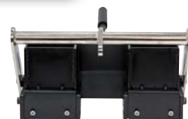
4 in x 4 in x 4 in SmartDie II

Aparcamientos, pasos de cebra, señalización, cruces y medianas, carriles bici, aeropuertos, zonas de paso de vehículos... No hay problema. El ThermoLazer se ha diseñado para fundir y aplicar casi todos los materiales termoplásticos para el trazado de líneas: pinturas alquídicas o con base de hidrocarburos, ya sea en sacos, en bloques o en ambos. Una amplia gama de zapatonos permite trazar líneas continuas (5-30 cm), líneas discontinuas y líneas dobles mediante la caja de reglas de «línea doble». El uso de plantillas le permite pintar texto y señales de parada y de advertencia de peligro.