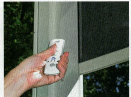
La pérgola se puede accionar fácilmente con el mando a distancia Somfy