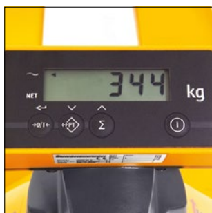
AMW 22 – display/unidad de mando