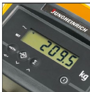
AMW 22p – display/unidad de mando