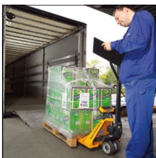
Pesajes eficientes con el AMW 22