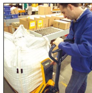
Óptima precisión con el AMW 22p