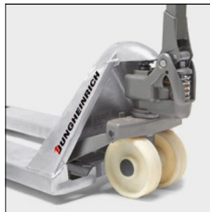
Conexiones de lubricación permanente para una utilización sin mantenimiento