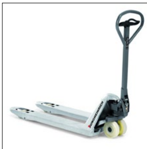
AM G20 - Protección contra la corrosión a través de la galvanización