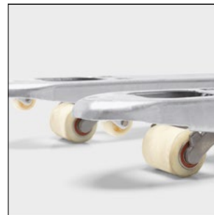
Puntas de horquillas redondeadas para facilitar la entrada en el palet