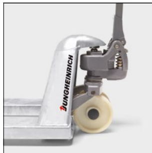
Hidráulica sin mantenimiento