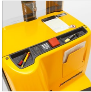
Diversas bandejas para tener los utensilios a mano