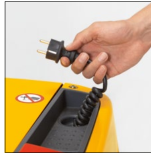
Cargador integrado también para baterías más grandes