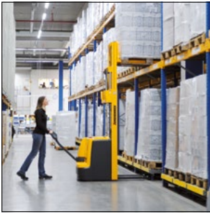
Apilado exacto y fácil