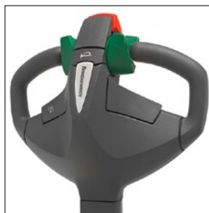
Corta y compacta: Ideal para llevar sobre camión