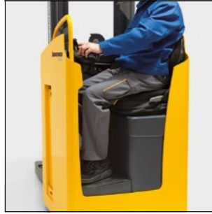
Posición de asiento confortable con placa de fondo regulable en altura