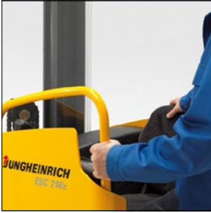
Estribo para un acceso seguro y como soporte para montaje de diversas opciones