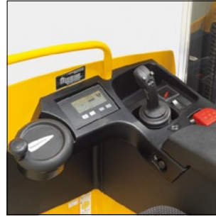
Disposición ergonómica de las unidades de mando