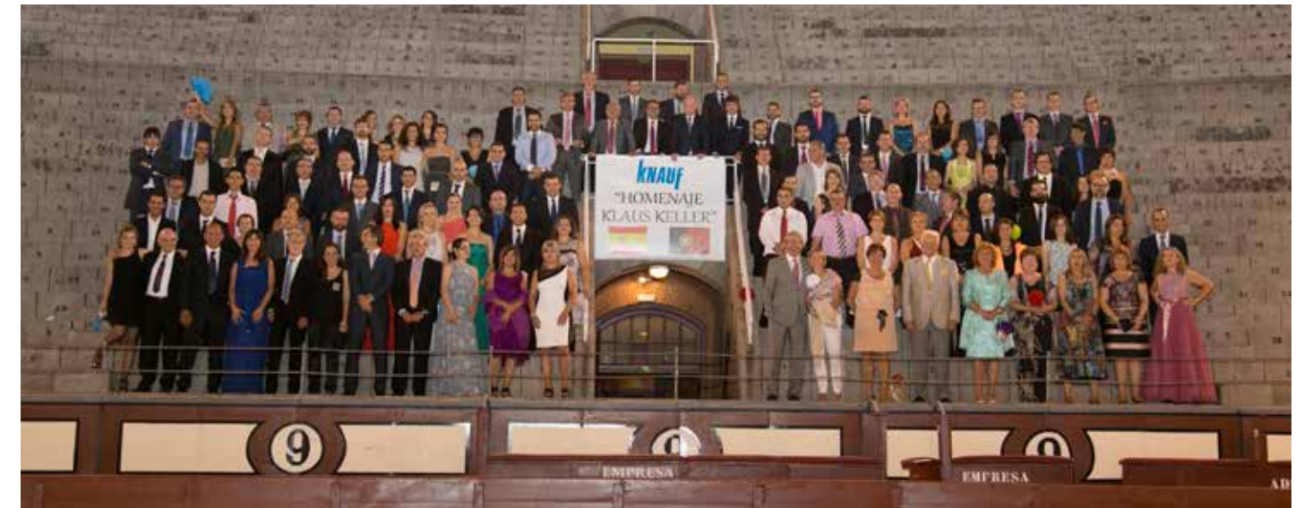
El equipo de Knauf GMBH Sucursal en España.

Además de haber logrado unos objetivos impensables en los duros inicios de esta Sucursal, haber alcanzado unos excelentes resultados de facturación, expansión de la compañía en el país con la construcción de otra fábrica, haber salido de varias crisis que han atravesado los países de España y Portugal, ha sabido transmitir los valores de Knauf a todo el Equipo humano que ha dirigido dentro y fuera de la empresa, como es la red de distribución.