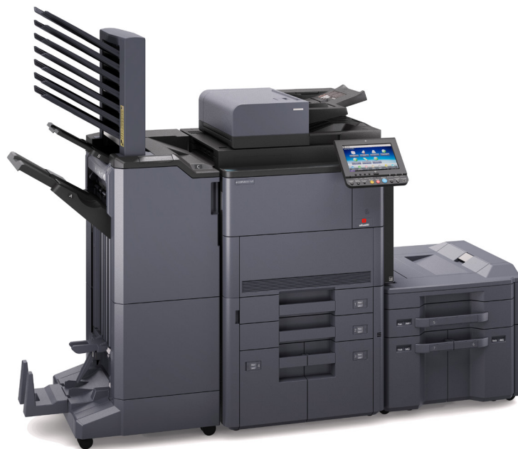
d-Copia 8001MF con PF-740+PF-7130+DF-7110+MT-730+BF-730