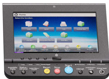
Pantalla táctil Color 9”