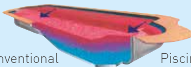
Piscina con Pool Valet

Después de seis ciclos, recibe nuevamente agua el mismo sector de boquillas, limpiando otro sector del suelo, y así sucesivamente.