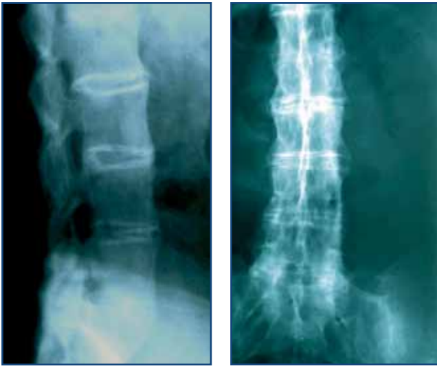
Figura 2A.- Radiografía lateral de columna lumbar que muestra la presencia de sindesmofitos