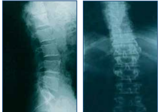
Figura 1A.- Radiografía lateral de columna lumbar, donde se aprecian osteofitos marginales

La analítica con hemograma, bioquímica, proteína C reactiva y orina fueron normales; los anticuerpos antinucleares (ANA) y el factor reumatoide (FR), negativos. El estudio radiológico dorso-lumbar presentó osteofitos marginales en cuerpos vertebrales con formación de puentes intervertebrales ( Figuras 1A y 1B ).