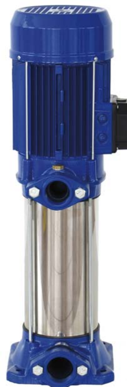
TABLA DE PRESTACIONES

MOTOR ELÉCTRICO: Asíncrono, con ventilación externa, apto para el funcionamiento continuo, aislamiento clase F y protección IP-44 a 2.850 rpm.