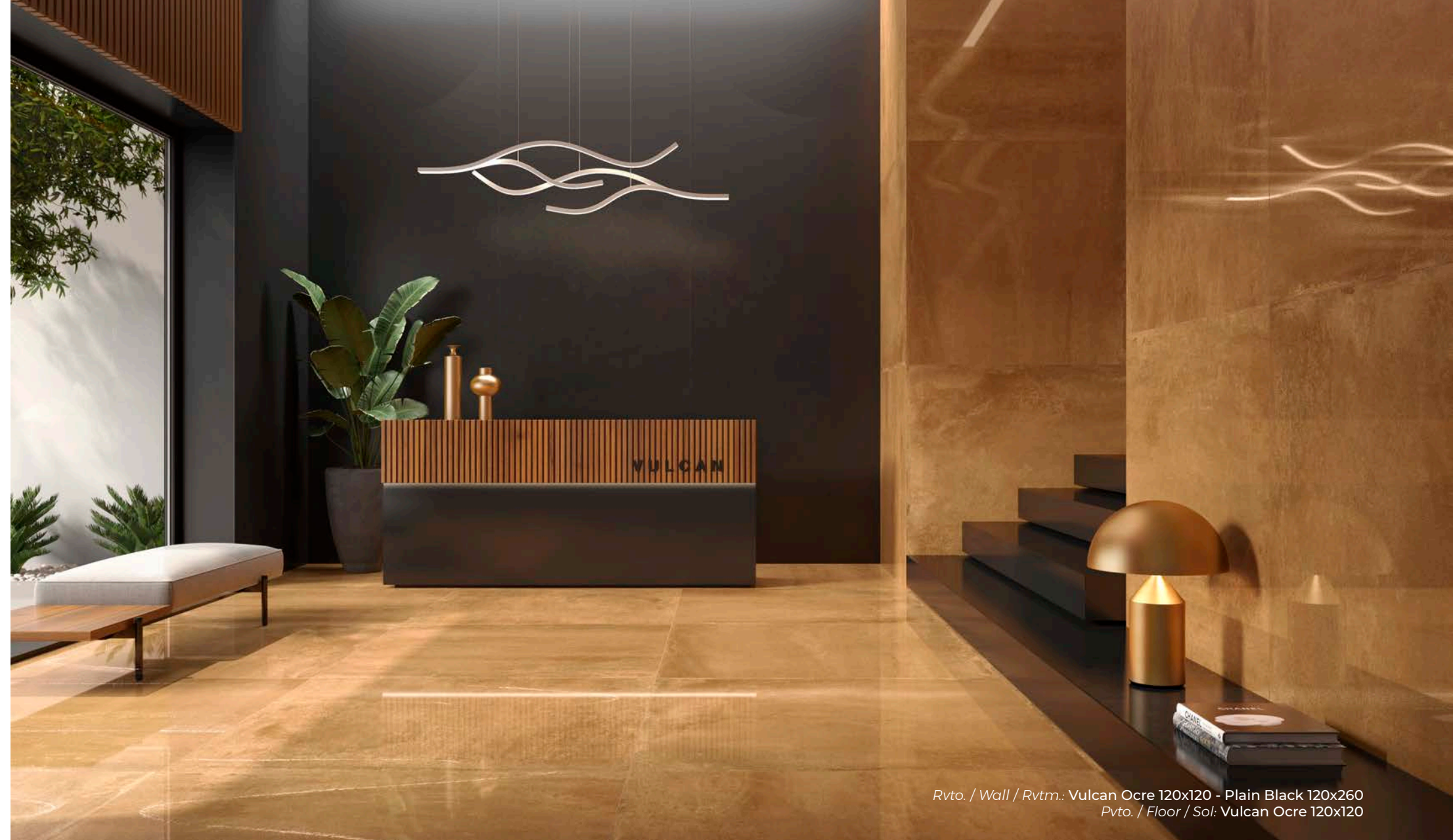
Rvto. / Wall / Rvtm.: Vulcan Ocre 120x120 - Plain Black 120x260 Pvto. / Floor / Sol: Vulcan Ocre 120x120