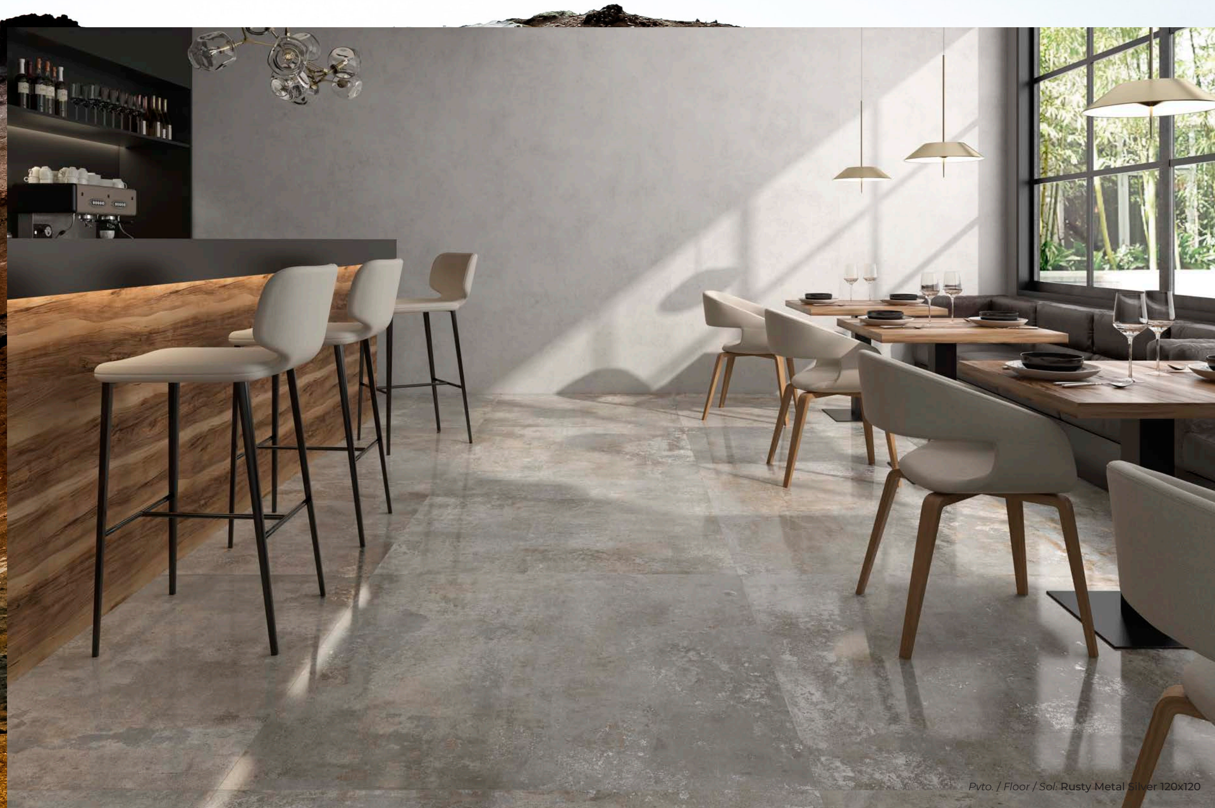
Pvto. / Floor / Sol: Rusty Metal Silver 120x120

Un grès cérame qui présente un mélange audacieux de couleurs qui contribuent à renforcer la personnalité et la profondeur de ce design. Avec ses tons intenses, sa texture innovante et son effet métallique, Rusty sera la star de tous vos projets.