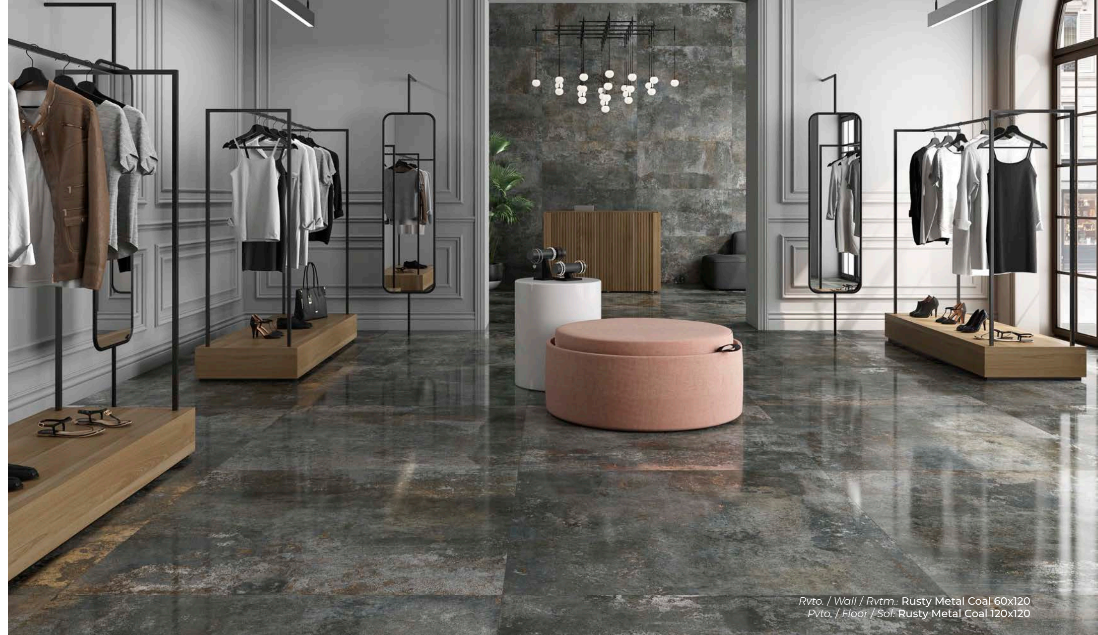
Rvto. / Wall / Rvrm.: Rusty Metal Coal 60x120 Pvto. / Floor / Sol: Rusty Metal Coal 120x120