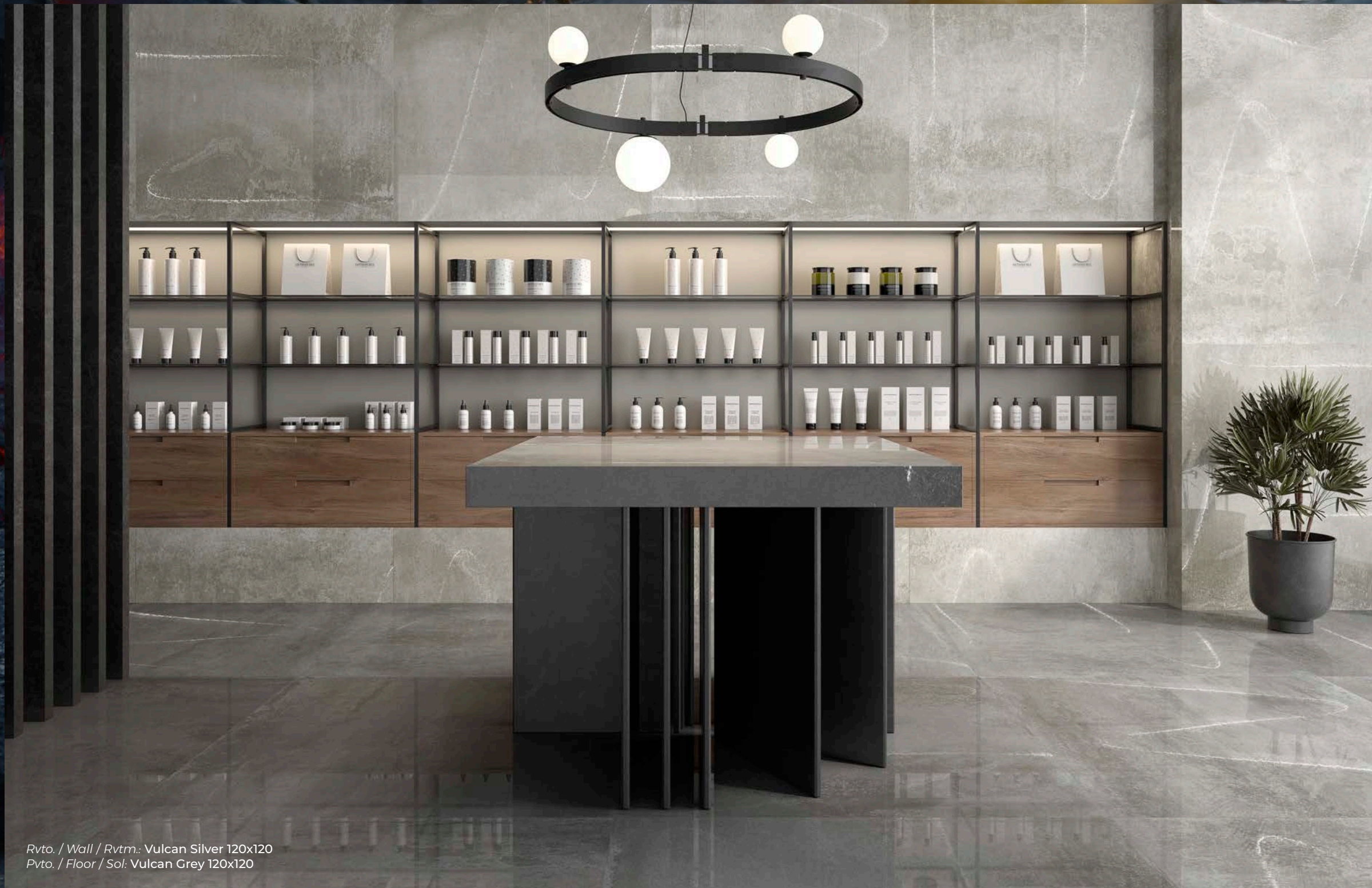
Rvto. / Wall / Rvtm.: Vulcan Silver 120x120 Pvto. / Floor / Sol: Vulcan Grey 120x120