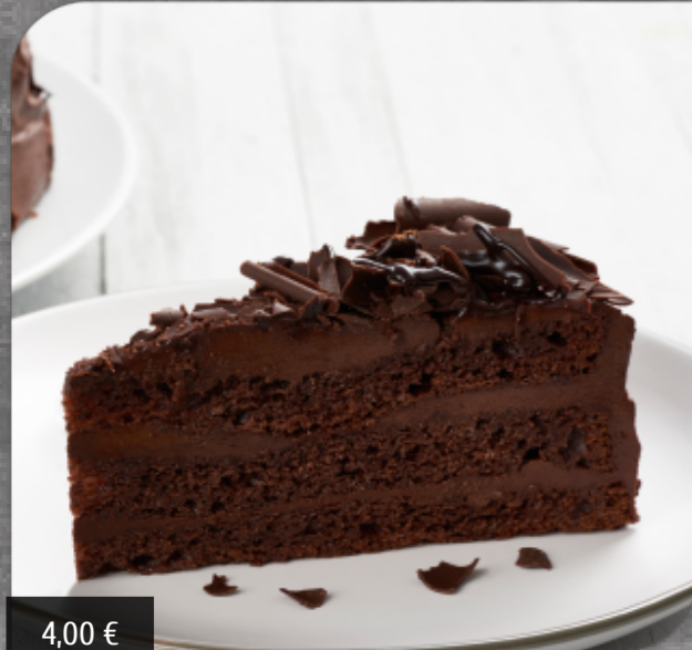
Tarta muerte por chocolate Biscocho de chocolate con crema de chocolate y recubierto con pepitas de chocolate