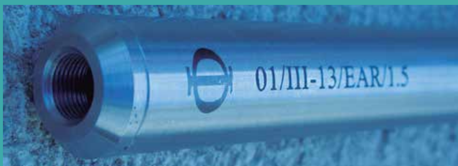
Cilindro para instalar a la entrada del conducto de agua.