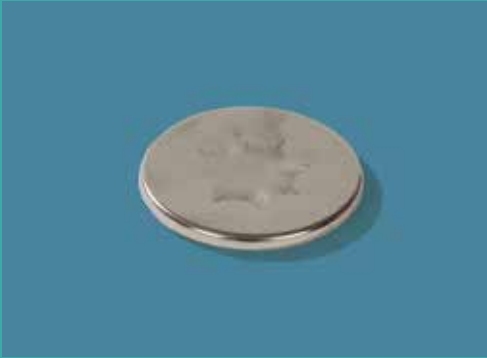
Para llevar: 78mm de diámetro.