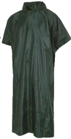
Verde Botella Dark Green