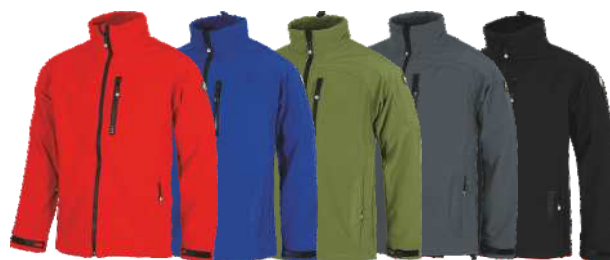
Rojo Red Azul Blue Verde Kaki Khaki Green Gris Grey Negro Black