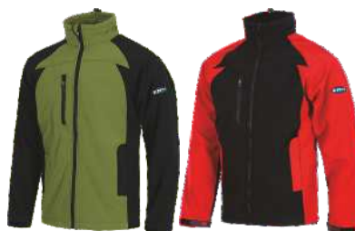
Verde Kaki/Negro Khaki Green/Black