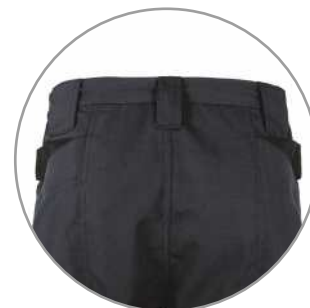
Detalle de la cintura Waist detail