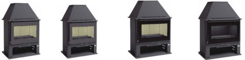
M-300 M-300 T M-300 TK M-300 TFK