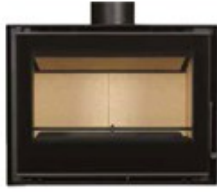
SALAMANDRA CRISTAL 69