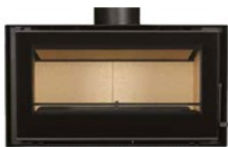
SALAMANDRA CRISTAL 98