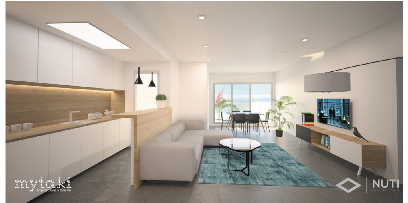
Infografía 3D interior de salón-cocina en concepto abierto.