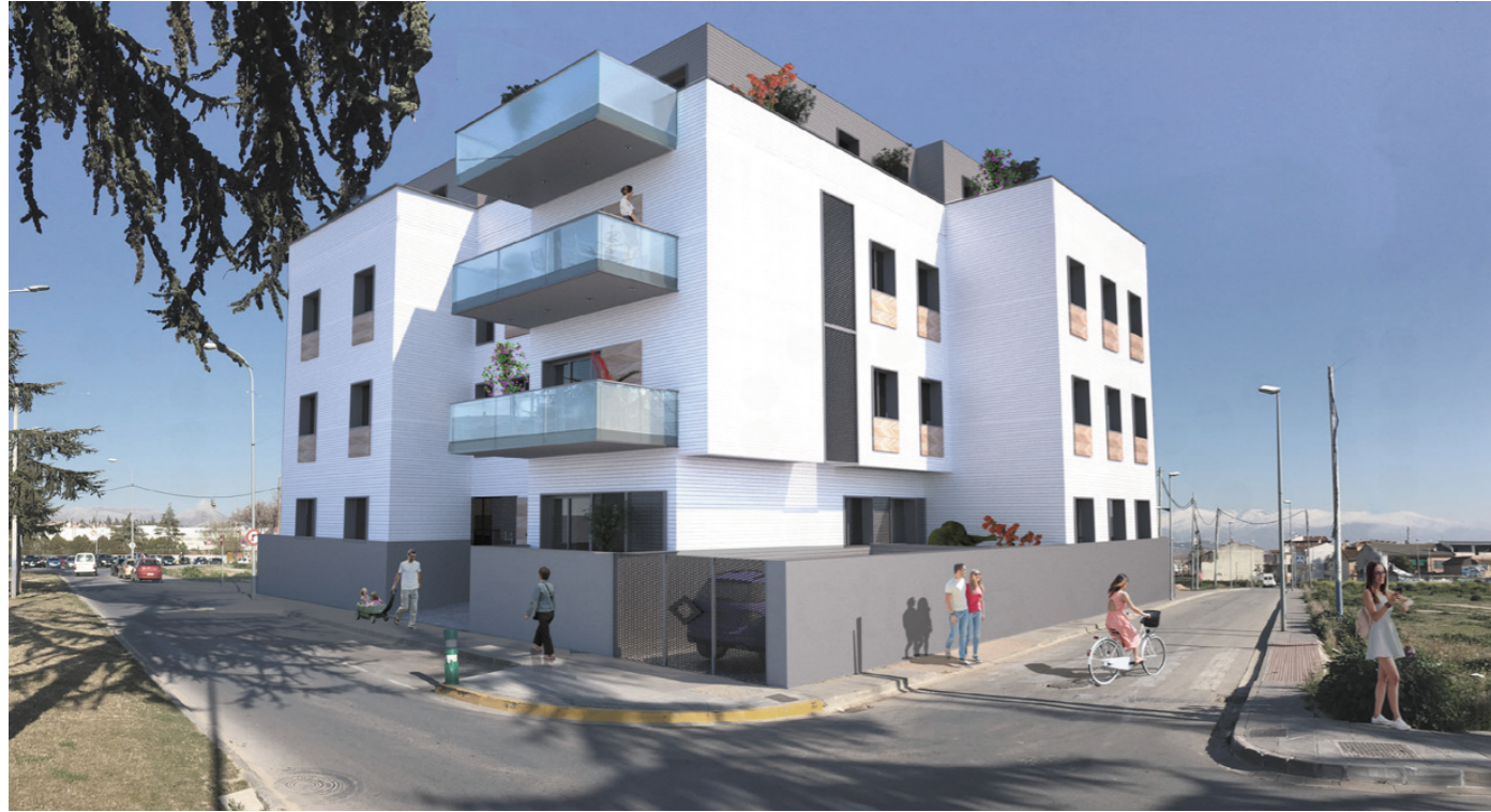
Infografía 3D desde el Norte.