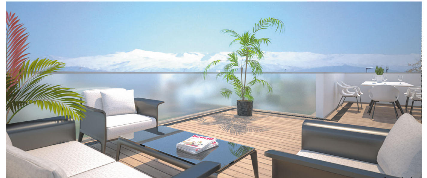
Infografía 3D de terraza de ático. Vistas hacia Sierra Nevada.

Situado en la entrada de Albolote, muy cerca del nuevo centro deportivo y con una ubicación privilegiada, le permite disfrutar de espectaculares vistas y amplios paseos a un paso de la autovía A-44 y del centro de Albolote y todos los servicios que ofrece. Un lugar idóneo para vivir y disfrutar de su tiempo libre.