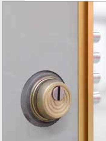
Protector de bombillo