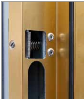
Regulador de resbalón