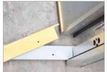
Remate al suelo