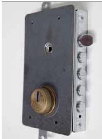
Chapa de manganeso