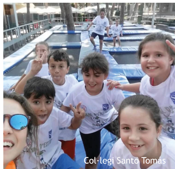
Col·legi Santo Tomás