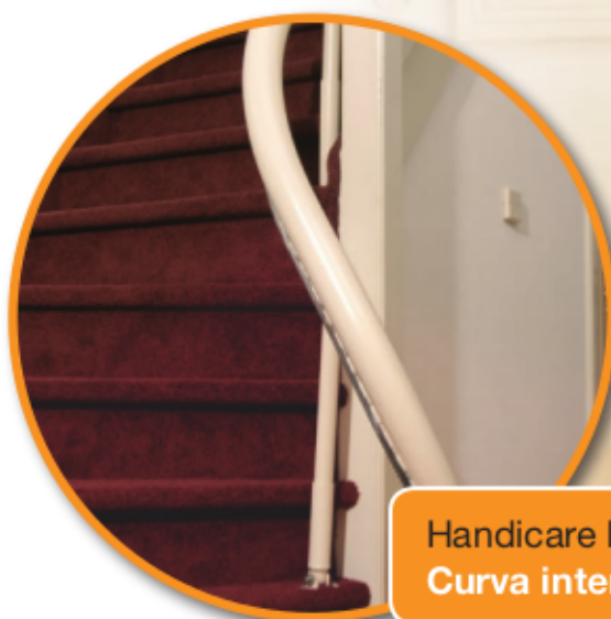
Handicare Rembrandt Curva interior