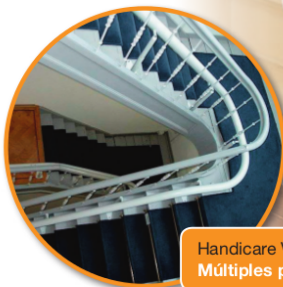
Handicare Vermeer Múltiples pisos