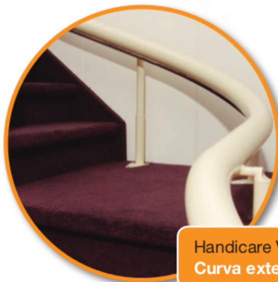
Handicare Van Gogh Curva exterior

Handicare tiene una solución para cada escalera. Todos los salvaescaleras curvos Handicare comparten las mismas características: son fáciles de manejar, silenciosos y tienen un diseño funcional. Gracias a los diferentes tipos de salvaescaleras, somos capaces de montar un salvaescaleras de Handicare en cada tipo de casa y ofrecer un desplazamiento seguro y cómodo, incluso en las escaleras más complicadas. El diseño compacto deja mucho espacio para los demás usuarios de las escaleras.