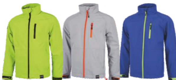
Verde A.V./Negro H.V. Green/Black