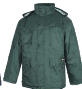
Verde Botella Dark Green