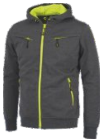
Gris/Amarillo A.V. Grey/H.V. Yellow