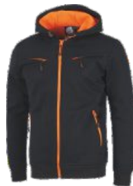
Negro/Naranja A.V. Black/H.V. Orange