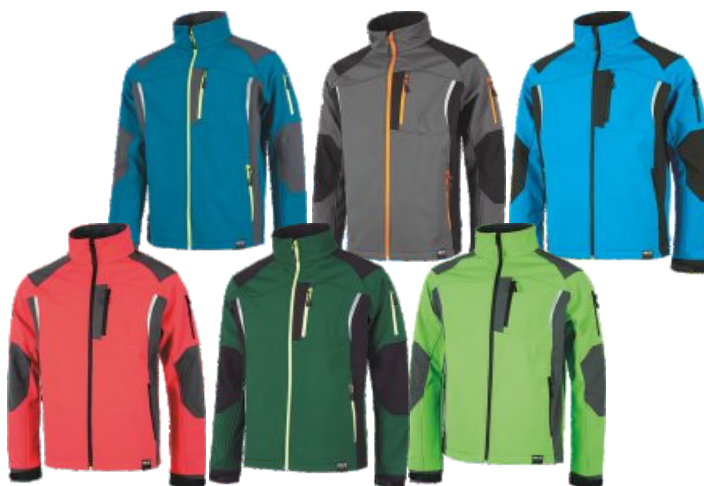
Azafata/Gris Light blue/Grey