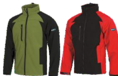
Verde Kaki/Negro Khaki Green/Black