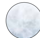
ACOLCHADO CON FIBRAS HIPOALERGÉNICAS