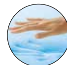
VISCOELÁSTICA CON GEL