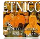
ETNICO, 2001 J.M. Ramos y Benito Cabrera