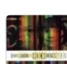
CONTRASTES, 2008 Benito Cabrera