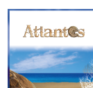
ATLANTES, 2015 Atlantes