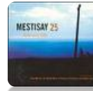
MESTISAY 25 AÑOS, 2006 Mestisay