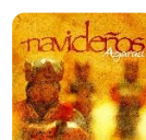
NAVIDEÑOS, 2010 Agarau