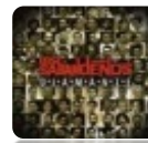
DIAMANTE, 2007 Los Sabandeños