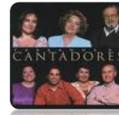
CANTADORES, 2002 Parranda de Cantadores