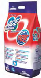
Ace Professional, 15 kg. Detergente