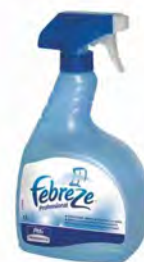
Febreze Professional, 1 l. Elimina olores