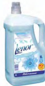
Lenor Professional Concentrado, 5 l. Suavizante