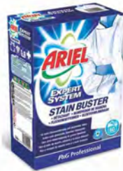
Ariel Stain Buster Detergente quitamanchas