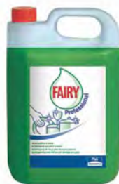
Fairy Professional Super Concentrado, 5 l. Lavavajillas manual