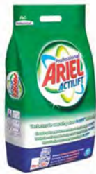
Ariel Professional 15 kg. Detergente completo