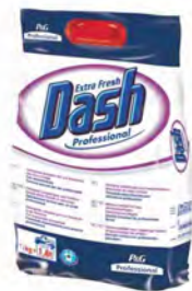
Dash Professional Extra Fresh, 13 kg. Detergente y suavizante