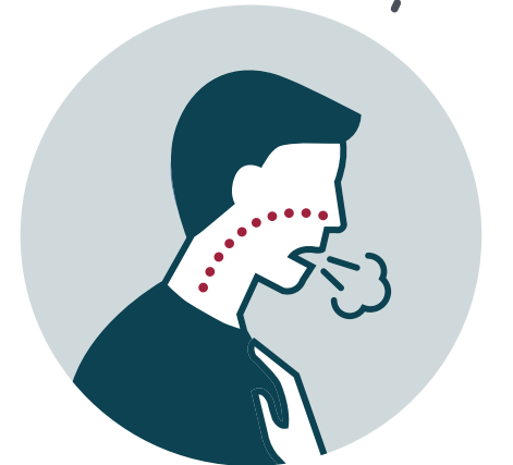
Sensación de falta de aire