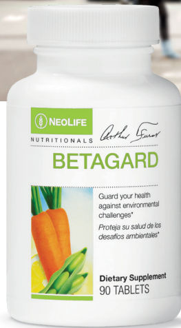
Betagard® #3530 – 90 tabletas

Los productos NeoLife utilizan sólo ingredientes libres de GMO.