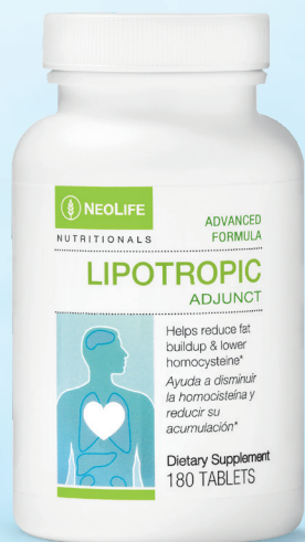
Lipotropic Adjunct™ #3510 – 180 tabletas