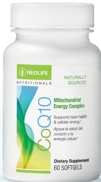
CoQ10 #3523 – 60 softgels