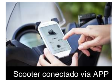
Scooter conectado vía APP