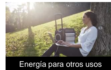
Energía para otros usos