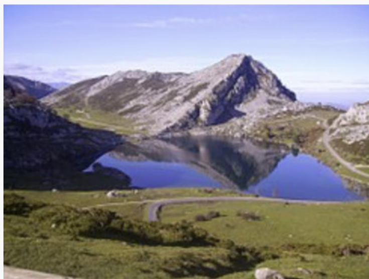
El lago Enol visto desde La Picota .