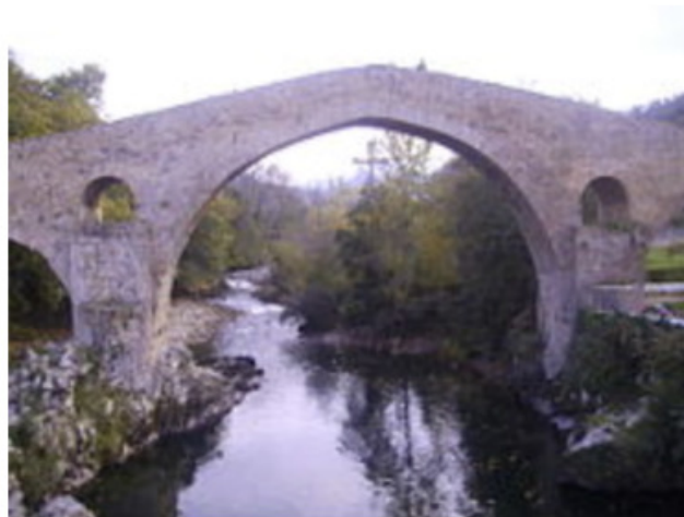
Puente de Cangas de Onís .

El Puente Romano de Cangas de Onís o Puentón es una construcción situada sobre el río Sella a su paso por Cangas de Onís , y que separa los concejos de Cangas de Onís y de Parres , perteneciendo, por tanto, la mitad a cada concejo. Su figura está asociada al pueblo de Cangas de Onís . [1]