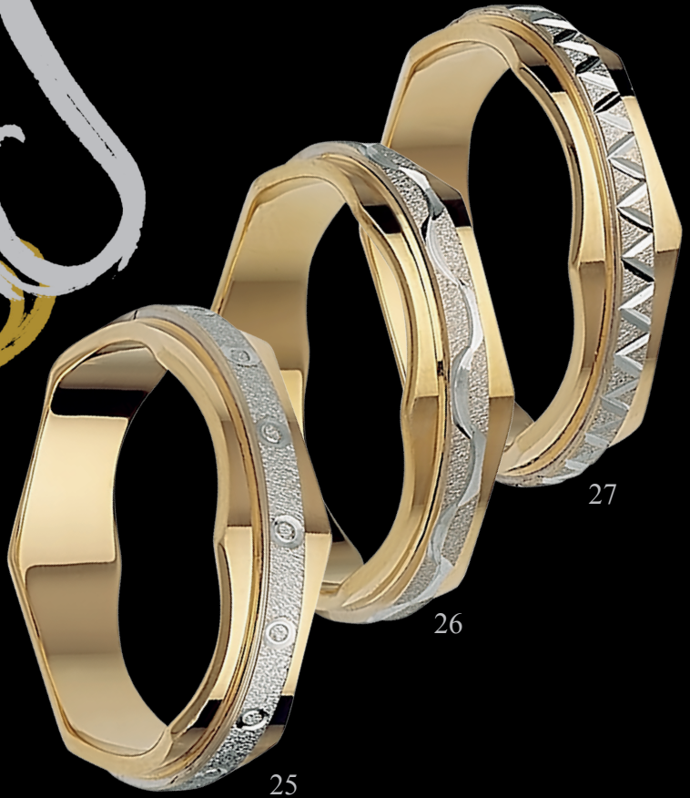
25. E60-809DT | 26. E60-811DT | 27. E60-801DT